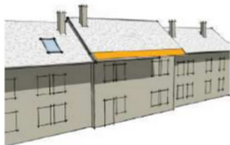
Aligné en bas de toiture